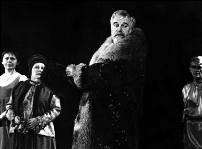
Стольник Нардын- Нащокин — В. Витько. Фото из архива театра