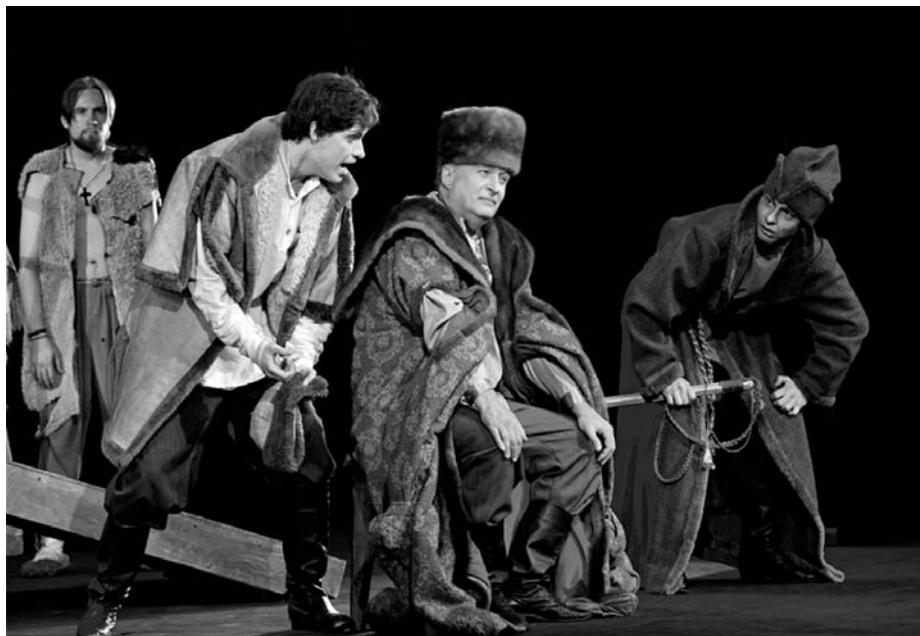
«Фрол Скабеев». Сцена из спектакля