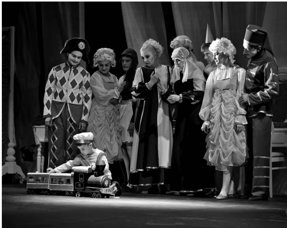
«Без вины виноватые»

работать над спектаклем по повести Чингиза Айтматова «Пегий пес, бегущий краем моря» .