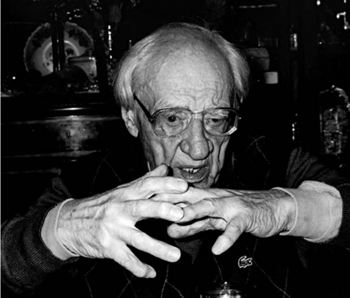
В гостях у Б. Покровского во время репетиции оперы «Обучение в монастыре»

рота следует в баню. Генерал: «Запевала, выйти из строя!» Я высказываю и сходу докладываю: «Рядовой такой-то следует в баню!» Генерал подошел ко мне ближе, пристально оглядел и говорит: «За отличное исполнение строевой песни объявляю запевале краткосрочный отпуск на родину, а роте благодарность. Встать в строй!» И с той минуты взял он надо мной «шефство». Велел отпускать меня в Дом Офицеров. В лютый мороз щадить мой голос и не ставить меня в караул. И стал я петь во всех праздничных концертах, а генерал всячески меня поддерживал!