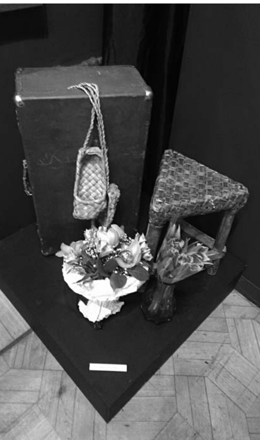
Личные вещи Татьяны Швец.