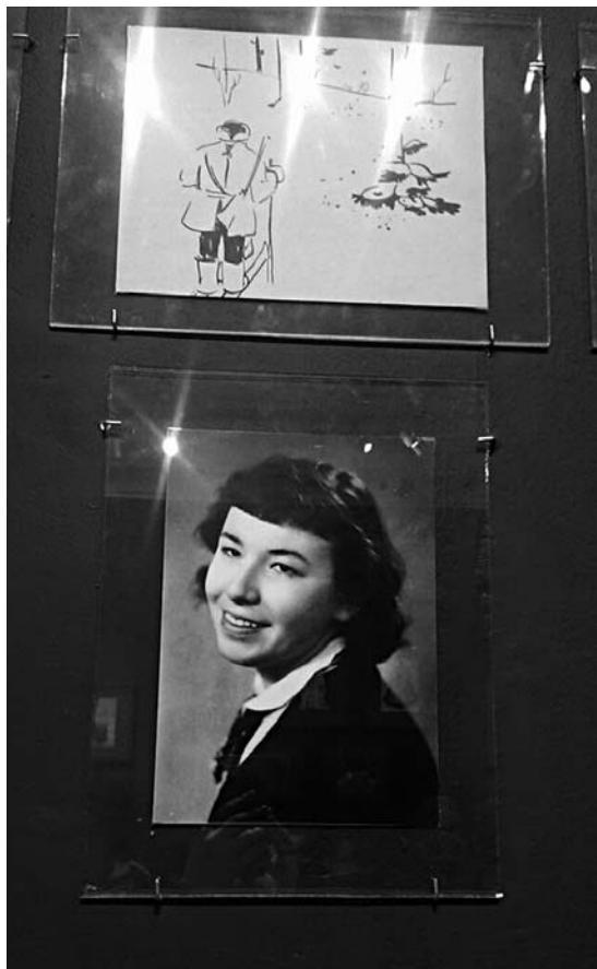
Фрагмент экспозиции.

гося театрального режиссера, художника и педагога Николая Павловича Акимова .