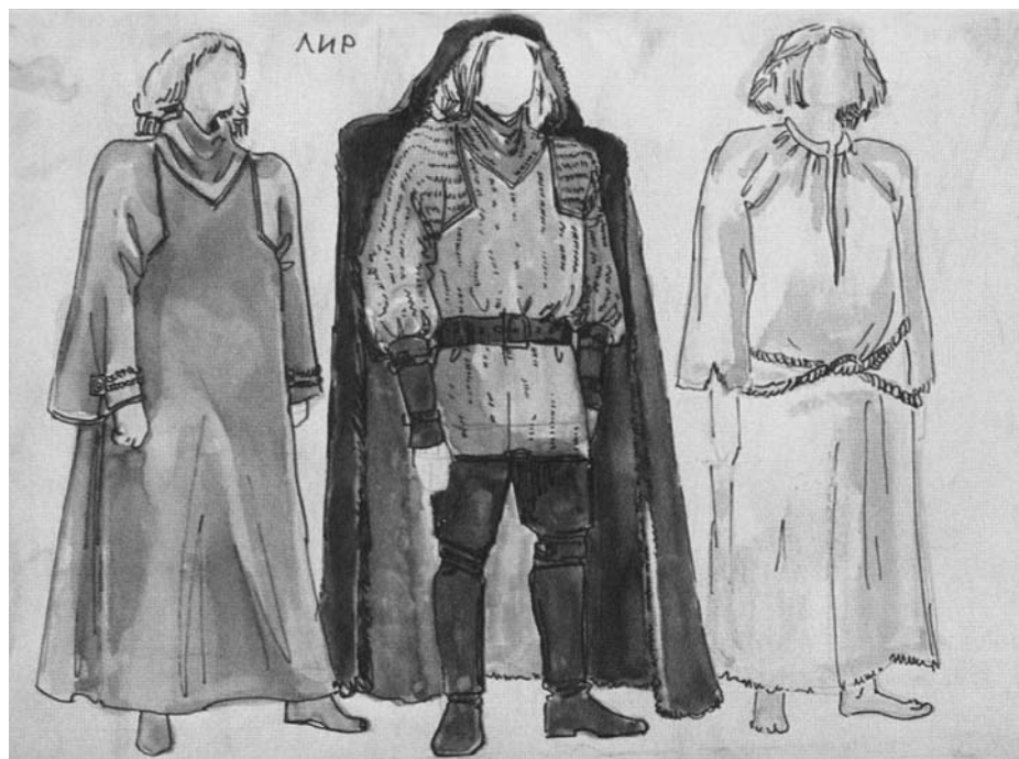
Эскизы костюма Лира. Бумага, гуашь, тушь, перо