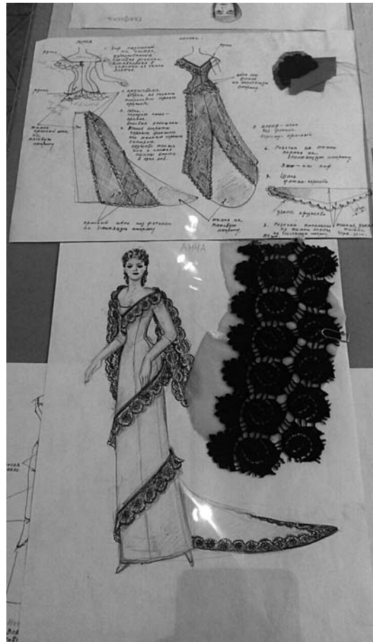
Фрагмент экспозиции.

Можно предположить, что максимальная сосредоточенность, умение всматриваться в суть предметов, чувствовать различные фактуры, которые всегда работают на образ спектакля, у Татьяны Маркиановны сформировались еще в детстве. Она родилась в Вологодской области в семье метеорологов, вместе с родителями подолгу жила