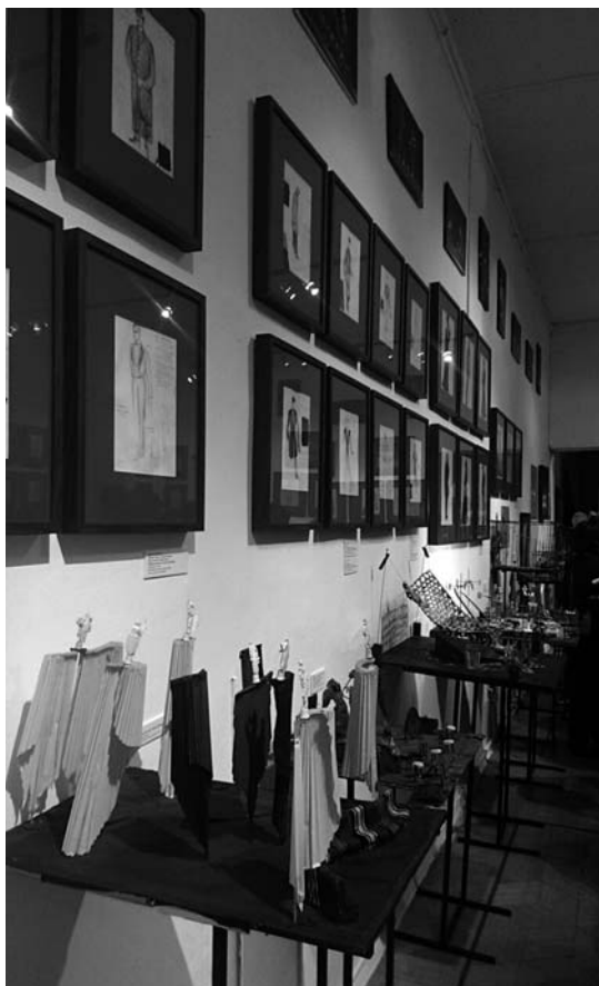
Фрагмент экспозиции.