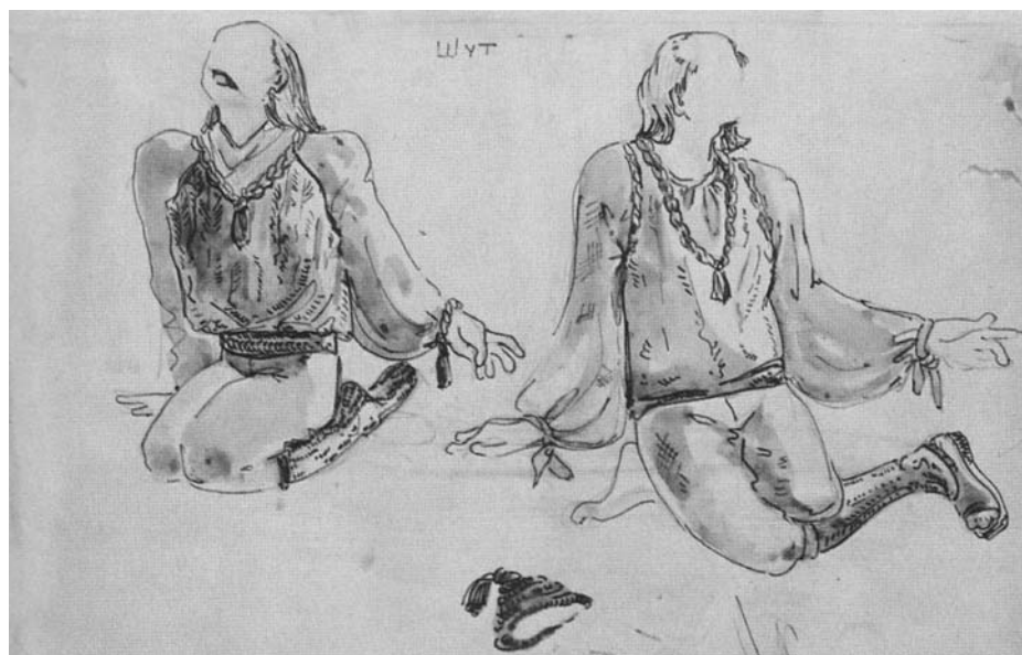
Эскизы костюма Шута. Бумага, гуашь, тушь, перо