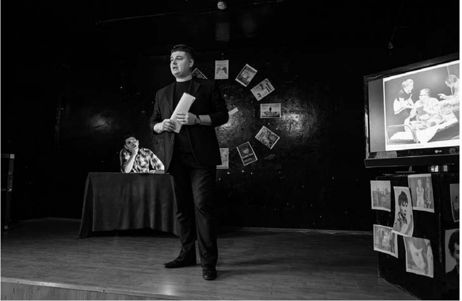
Научно-практическая конференция к 80-летию со дня рождения А. Вампилова

зданных актерами, приняли участие студенты института.