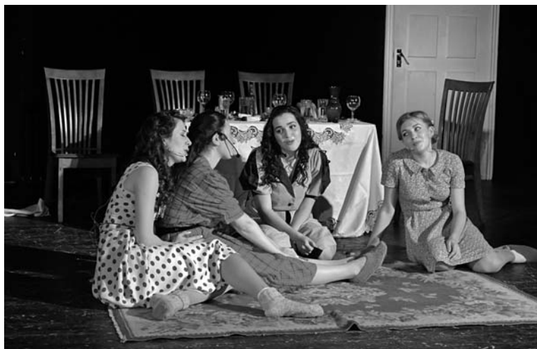
«Сегодня праздник у девчат»

За весь спектакль не было произнесено ни одного монолога или диалога — героини только пели. Но зрителю было все понятно и без слов. Итак, девушка перед грядущей свадьбой устраивает вечерин-